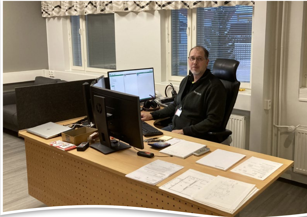
Puheenjohtajan tehtäviin kuuluu valittavan paljon myös toimistotöitä.

Hallitustyöskentely vaatii joskus myös lujaa luonnetta. Yhteisten asioiden hoidossa, niin usein, saamme myös sen kai-