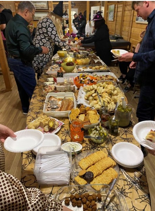
Nyöttäripöydässä riitti naposteltavaa koko illaksi.

Saapuminen meni perjantai-iltaan, hämähä oli jo laskeutunut alueelle. Tunnelmaa luomaan oli syytetty ihana määrä kynttilöitä asuntovaunujen ja autojen läheisyyteen. Sanoisinko, että tunnelma oli kohdillaan.