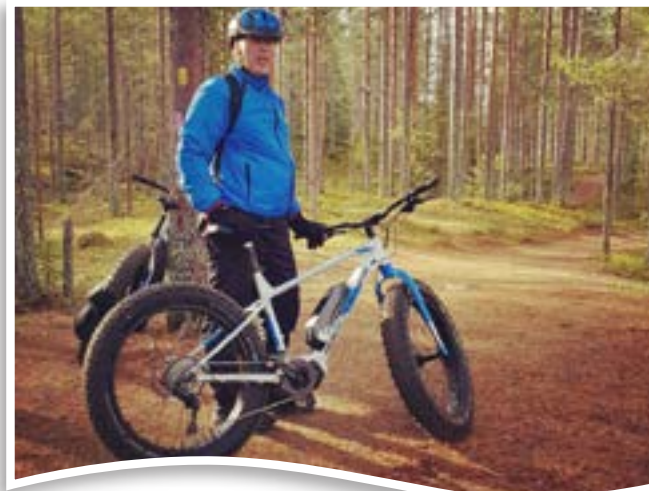
Puheenjohtajakin kokeili myös toisenlaista harrastusta, maastopyöräilyn merkeissä.

Syksyn kääntyessä talveksi on yhdistyksemme aloittanut myös suuren rakennusprojektin. Vuosia suunniteltu ja tarpeelliseksi katsottu huoltorakennusten laajennus on vihdoon aloitettua. Uusi huoltorakennus (HR3) tuo alueellemme uusia mahdollisuuksia, helpottaa päivittäistä asiakaspalvelua ja luo hyvät edellytykset erityisesti uudelle matkailijaryhmälle, jotka matkustavat ympäri vuoden. Tämän jälkeen olemme aidosti ympäri vuoden palveleva leirintäalue, 8-tien varressa lähellä kaupungin palveluita, ihan meren rannassa.