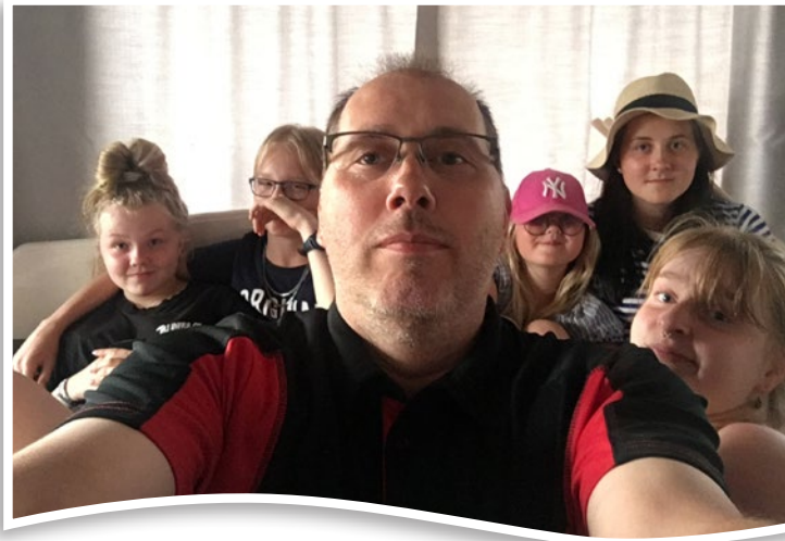
Harjoiteltiin Pyrstön nuorien kanssa selfien ottoa. Aroaa kuka ei kuulu joukkoon.

Kesä kulkee vilkkaasti eteenpäin. Korona-tilannetta seuraten pyrimme järjestämään lastentapahtuman viikko koulujen aloituksen jälkeen elokuussa. Toki, jos tilanne sallii, järjestämme alueen perinteiset Rosvopaistit syyskuun eka viikonloppu. Toivotaan, että pandemia ei ryöpsähdä uudestaan toiseen aaltoon vaan saamme pikkuhiljaa palata normaaliin, käsiämme pesten ja kontakteja välttäm.