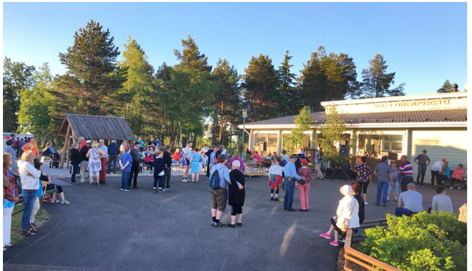
Pihatanssit saivat tanssikansa liikkeelle niin vaunujen välisellä nurmella kuin asfalttipihallakin.