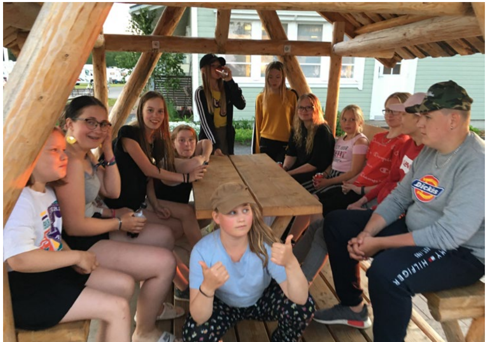
Pyrstön nuorista osa ehti pysähtyäkin nautiskelemaan Juhannuksen tunnelmasta.