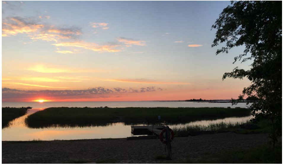
Juhannusyön taikaa, meri tyynenä levähtää.